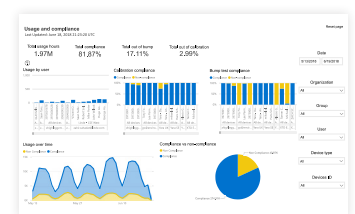
Plataforma de informes Blackline Analytics